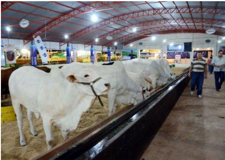
Ejemplares vacunos de alta genética se pueden apreciar en la Expo Santa Rita 2013.

Preparan remate de unos 800 ganados en la Expo San Rita -- SANTA RITA (De nuestra redacción regional). Al menos 800 ganados serán rematados mañana en la feria invernada a campo en la XXI Expo Santa Rita. El sector de ganadería es uno de los principales atractivos de la muestra que se desarrolla desde el viernes 3 de mayo en el Centro de Tradiciones Gaúchas (CTG) Indio José, de esta ciudad.